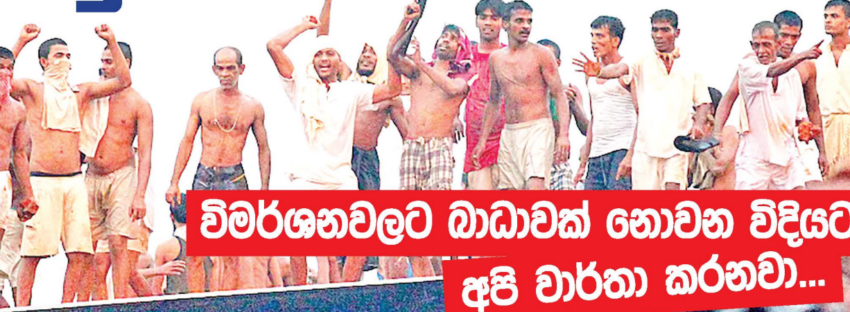
විමර්ශනවලට බාධාවක් නොවන විදියට අපි වාරතා කරනවා...

පමණක් සීමාවූයේ නැත. බෝගම්බර මෙන්ම පැලවින්න සංක්‍රමණ කඳවුරු දක්වා ව්‍යාප්ත වී තිබුණි. පැලවින්න කඳවුරෙන්ද රුද්‍රවලින් 131 දෙනෙක් පලා ගියහ. මෙහිදී පලාගිය වැඩි දෙනෙක් ජීවිත සාමාජිකයන්ය.