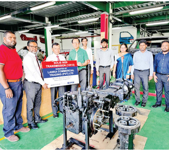
රත්මලාන පිහිටි කටුනායක ආරක්ෂක විශ්වවිද්‍යාලය (KDU) සහ හෝමාම මාකෂික විද්‍යාලය යන ආයතන වෙත ට්‍රැක්ටර් ගිසර්බොක්ස් පරිත්‍යාග කිරීම සිදුකෙරිණි.

ලංකා කොමර්ෂල් ට්‍රේඩින් පුද්ගලික සමාගම (LCT) මගින් රටේ කෘෂිකර්ම ක්ෂේත්‍රයේ දියුණුවට දායක වීමේ අරමුණින් විශේෂ දායකත්ව වැඩසටහනක් ආරම්භ කර ඇත. ඒ අනුව, කෘෂිකර්මක ඉංජිනේරු පාඨමාලා පැවැත්වෙන ආයතන වෙත නවීන කෘෂිකර්මයෙන් යුක්ත සිව් රෝද ට්‍රැක්ටර් ගිසර් බොක්ස් නොමිලේ පරිත්‍යාග කිරීම 2026 අප්‍රේල් 29 දින ආරම්භ විය. මෙම ගිසර් පද්ධතිය 12 x 12 වේග පරාසයකින් සමන්විත වන අතර Synchronesh හා Synchro Shuttle තාක්ෂණයන් යටතේ ක්‍රියාත්මක වේ. මෙම නවීන ගිසර් පද්ධති හරහා යන්ත්‍රයේ ගිසර් මාරු කිරීම සුමටව සහ කාර්යක්ෂමව සිදුකිරීමට හැකියාව ලැබේ. මෙම වැඩසටහන යටතේ, කොළඹ නාවල පිහිටි විවෘත විශ්වවිද්‍යාලය, මාලබේ පිහිටි CINEC Campus,