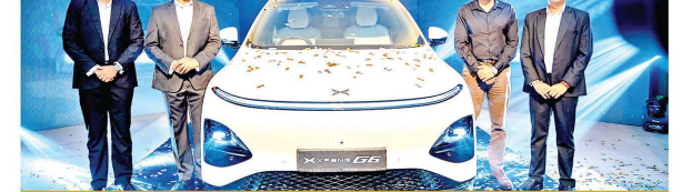
විදුහත් මෝටර් රථ ක්ෂේත්‍රයේ නව යුගයක්

ශ්‍රී ලංකාවේ XPENG සන්නාමයේ නිල බෙදාහරින්නා වන Evolution Auto (Pvt) Ltd විසින් නවතම XPENG G6 විදුලි SUV රථය 2026 මැයි 22 වැනිදා කොළඹ 05 හි පිහිටි Evolution Auto පුද්ගලික සේවයේදී නිල වශයෙන් එළිකළහ. මෙම හඳුන්වාදීම ශ්‍රී ලංකාවේ වේගයෙන් වර්ධනය වන විදුලි මෝටර් රථ වෙළෙඳපොළේ වැදගත් සන්ධිස්ථානයක් ලෙස සැලකේ. මෙම උත්සවයට මාධ්‍ය වේදිකේ, කර්මාන්ත නියෝජිතයන් සහ ආරාධිත අමුත්තන් එක්වූ අතර, XPENG G6 රථය නිල වශයෙන් එළිදැක්වීමත්, එය සජීවීව දැකබලාගැනීමටත්, ඒ පිළිබඳ සවිස්තරාත්මක තොරතුරු දැනගැනීමටත්, ධාවන පරීක්ෂාවක් (test drives) ඇත්දැකීමක් ලබාගැනීමටත් පැමිණි සිටි පිරිසට අවස්ථාව ලැබුණි. XPENG G6 හඳුන්වාදීම සිදුවන්නේ ශ්‍රී ලංකාවේ විදුලි මෝටර් රථ වෙළෙඳපොළ සඳහා ඉතා වැදගත් අවස්ථාවකදීය. විදුලි මෝටර් රථ සඳහා ජනතා උනන්දුව ඉහළ යමින් තිබුණද, එක් ආරෝපණයකින් ගමන් කළ හැකි දුර, උසස් මට්ටමේ විද්‍යුත් සංගීතය සහ අලෙවියෙන් පසු සේවා පිළිබඳ ගැටලු වෙළෙඳපොළ තුළ පැවැතී. XPENG G6 එම ගැටලු සියලුම විසඳුම් ලෙස හඳුන්වා දී ඇත.